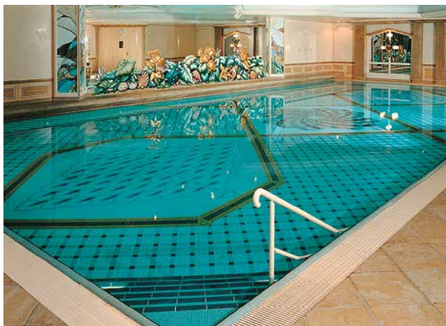
Joints très résistants, stables au courant, pour les zones immergées (en construction de piscine).