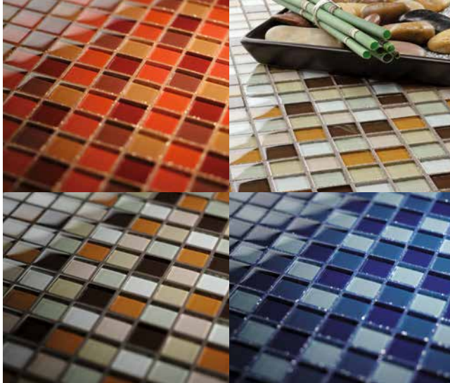
Mosaïque de verre, jointoyée avec le Joint époxy déco Sopro Topas DFE en divers coloris