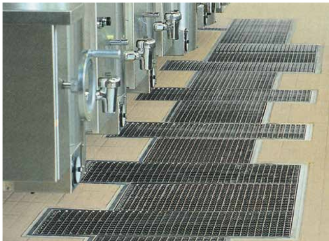
Joints soumis à de fortes contraintes mécaniques et chimiques en domaine professionnel (industrie des produits alimentaires)