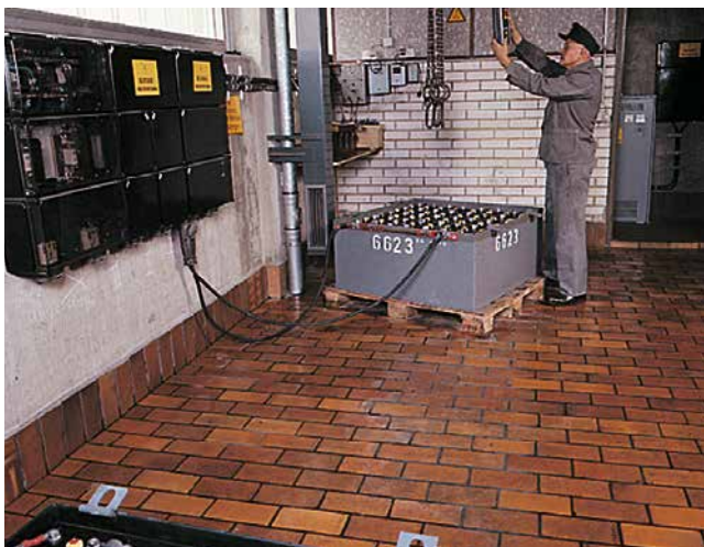
Jointoiment base résine réactive dans les domaines exposés à des contraintes par les acides et les produits chimiques, par exemple dans les locaux de recharge d'accumulateurs.