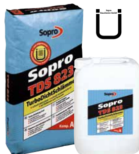
Imperméabilisation turbo 2K Sopro TDS 823

Imperméabilisation turbo 2K Sopro TDS 823 Par couche: env. 2 heures