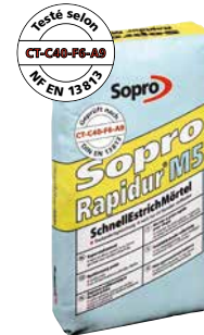
Mortier rapide pour chape Sopro Rapidur® M 5