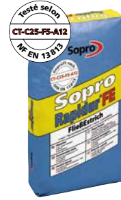
Chape liquide Sopro Rapidur® FE 678