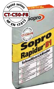
Liant rapide pour chape Sopro Rapidur® B 1