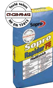
Chape liquide Sopro Rapidur® FE 678