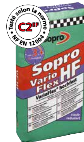
Mortier-colle flexible Sopro VF HF 420, haute résistance

Mortier-colle flexible Sopro VF HF 420 Circulable après env. 2 heures