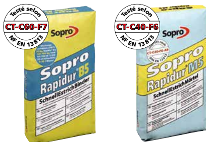
Liant rapide pour chape Sopro Rapidur® B5