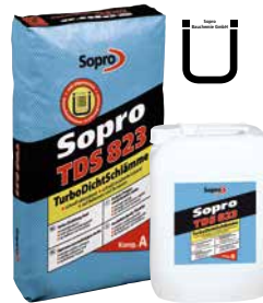
Imperméabilisation turbo 2K Sopro TDS 823

Imperméabilisation turbo 2K Sopro TDS 823 Durée de séchage: env. 2 heures (par couche)