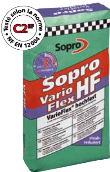
Mortier-colle flexible Sopro VF HF 420

Mortier ciment monocomposant, coulant, flexible, rapidement très résistant, à durcissement super rapide.