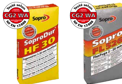
Joint large SoproDur® HF 30 (Domaines soumis à fortes contraintes)