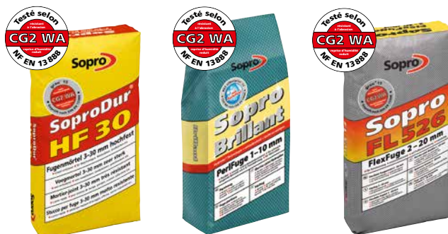
Joint large SoproDur® HF 30 (Domaines soumis à fortes contraintes)