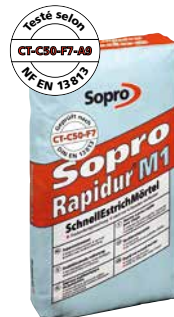
Mortier rapide pour chape Sopro Rapidur® M 1