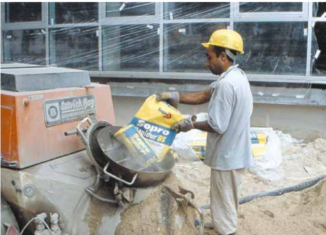
Mise en œuvre simple du Liant Sopro Rapidur® B 5 grâce au dosage facile sur le chantier.

La pose d'un revêtement en céramique est alors possible 12 heures (Liant Sopro Rapidur® B 1), 24 heures (Chape liquide Sopro Rapidur® FE 678) ou env. 3 jours (Liant Sopro Rapidur® B 5) après mise en place de la chape.