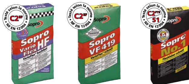
Mortier-colle Sopro VF HF 420