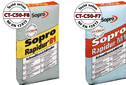
Liant rapide pour chape Sopro Rapidur® B1