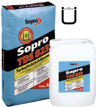
Imperméabilisation turbo 2K Sopro TDS 823

Badigeon ciment flexible, bicomposant, à prise rapide, destiné à la réalisation d'une imperméabilisation rapide, avec pontage des fissures. Système à deux composants, donc séchage à cœur indépendant des intempéries. Extrême flexibilité grâce à une dispersion polymère haute performance. Consommation très basse grâce à l'importante épaisseur de couche sèche.