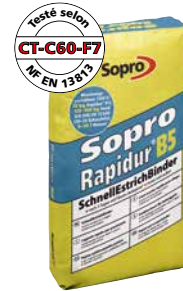
Liant rapide pour chape Sopro Rapidur® B 5