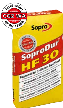
Joint large SoproDur® HF 30

Mortier de jointoiment ciment, très résistant, à durcissement rapide, avec trass, pour les secteurs soumis à des sollicitations particulièrement importantes.